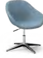
PEQUEÑO / Petita / Petit / Small / Klein