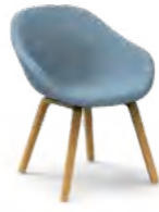
PEQUEÑO / Petita / Petit / Small / Klein