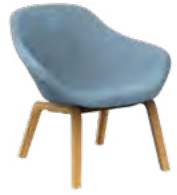
GRANDE / Gran / Grand / Big / Gross